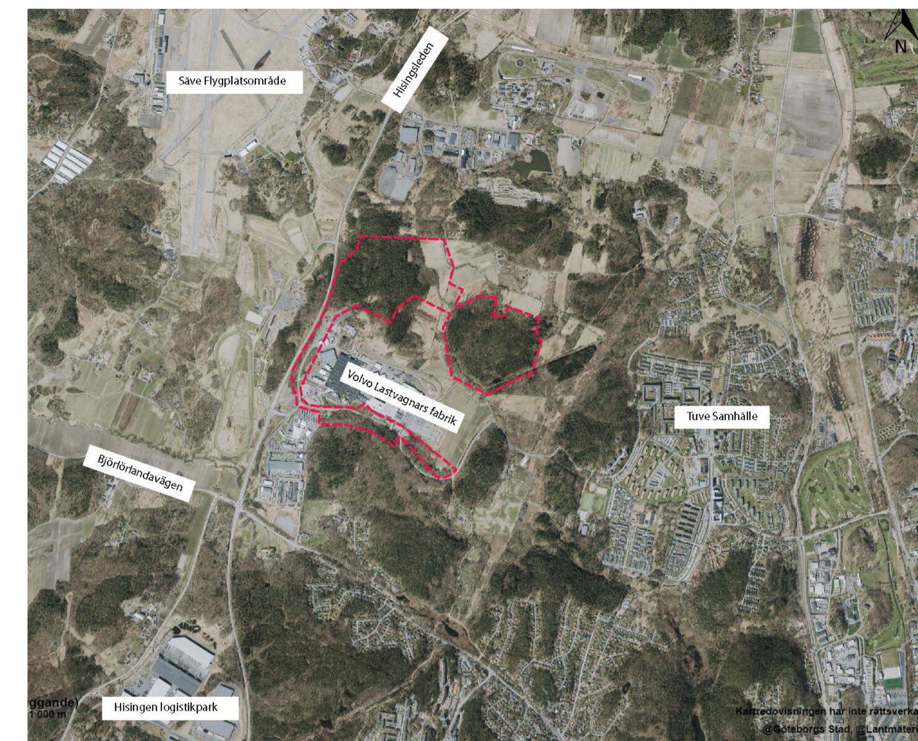
Röd markering visar planområdets placering i närområdet. Stadsbyggnadsförvaltningen, 2023.